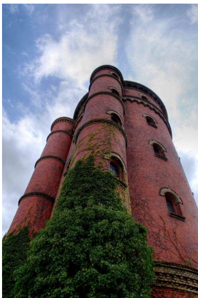
piqs, Till Krech

- Wo verstecken wir unsere Schönheit, um unsere Geschlechtlichkeit nicht zeigen zu müssen?