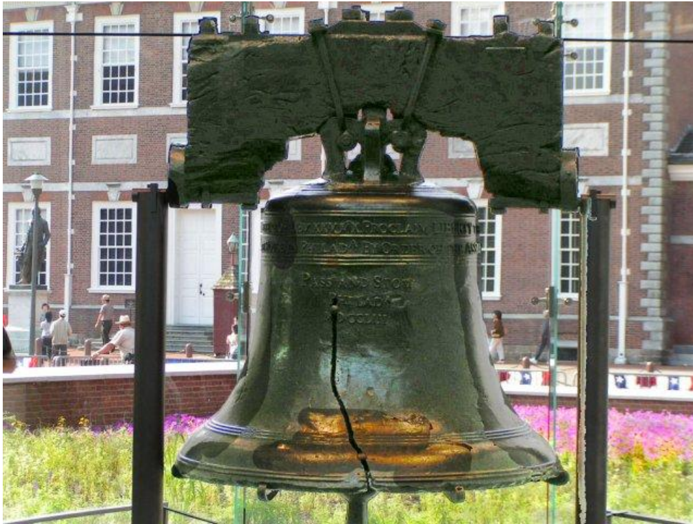
Liberty Bell

Das eigene kleine feine Glöckchen in der Welt erklingen lassen.