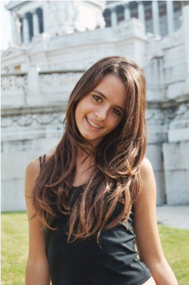
A. Thompson, piqs.de