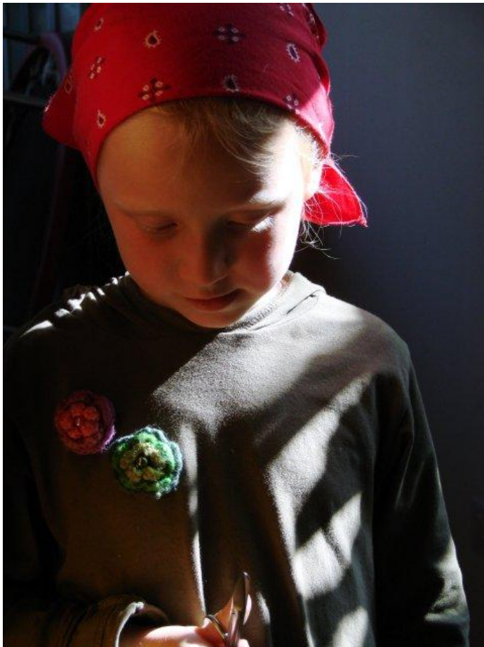
Kind mit Schere

Rapunzel ist so stark in der Symbiose dass sie der Zauberin die Begegnung mit dem Prinzen auch noch gesteht. Es ist schwer uns von den Eltern zu lösen, wir empfinden das als Verrat. Die Zauberin denkt nur an sich, das wird hier deutlich, sie will Rapunzel besitzen. Um zu verhindern, dass der Prinz nochmal kommen kann, schneidet sie ihr die Haare ab. . Das ist der Beginn der Trennung und der gelungenen Liebe. Nachdem Rapunzel ihre Haare dem Prinzen zugeworfen hat, sind sie für die Zauberin nicht mehr interessant. Sie spürt, dass sie Rapunzel so im Turm nicht mehr halten kann. Wir kennen das von Gängen zum Friseur: Hinterher fühlt man sich ein Stück weit neuer. Man hat altes Haar mit alten Informationen hinter sich gelassen. Der Kopf fühlt sich weiter an. Zum Glück gibt es Haare Schneiden!! Jedes Haare Schneiden ist ein Stück weit ein geistiges Abschneiden der Nabelschnur zur Mutter.